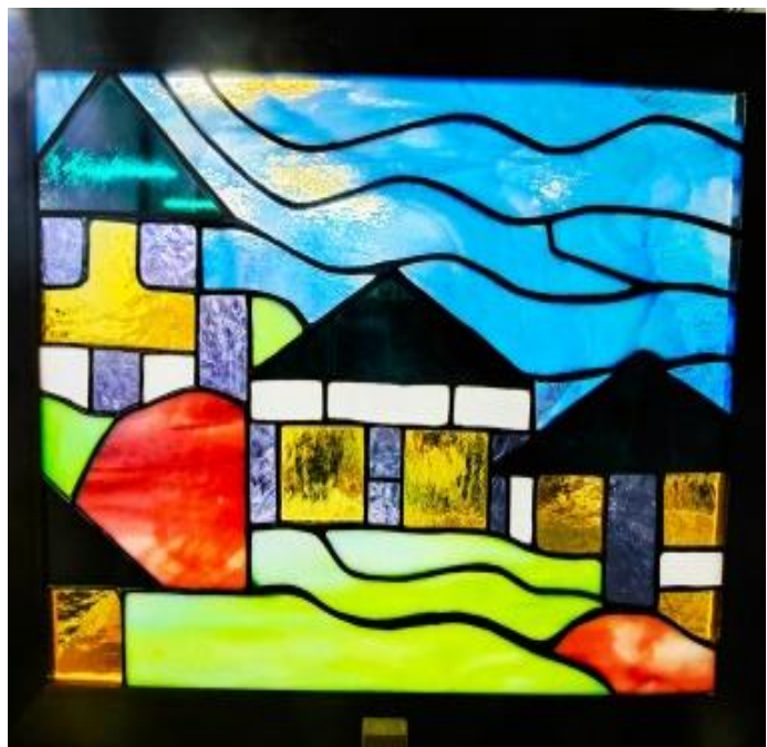
★十字直角カット4 (=直角カット16コ)、長い曲線、直線カット、同サイズカット。★直線カット、長い曲線。