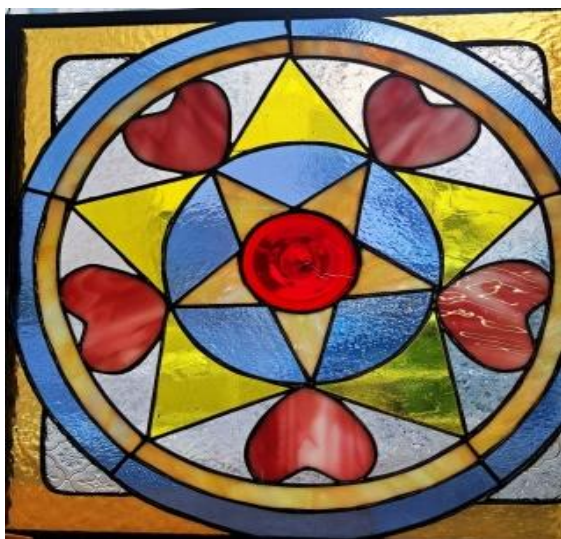
★長い曲線、直角カット