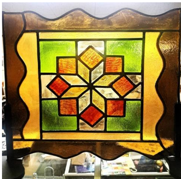
★長い曲線、直線、直角カット、同サイズカット。★長い曲線、直線、直角カット、同サイズカット、沿線技法。